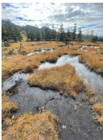
③三ノ沼からの眺望