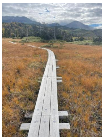
②二ノ沼湿原と大雪山