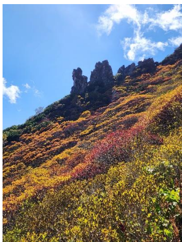
②黒岳九合目マネキ岩付近