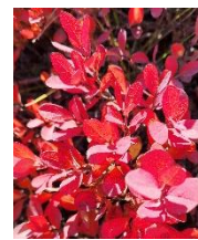
ヒメクロマメノキ