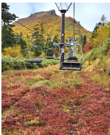
①黒岳リフト乗車中