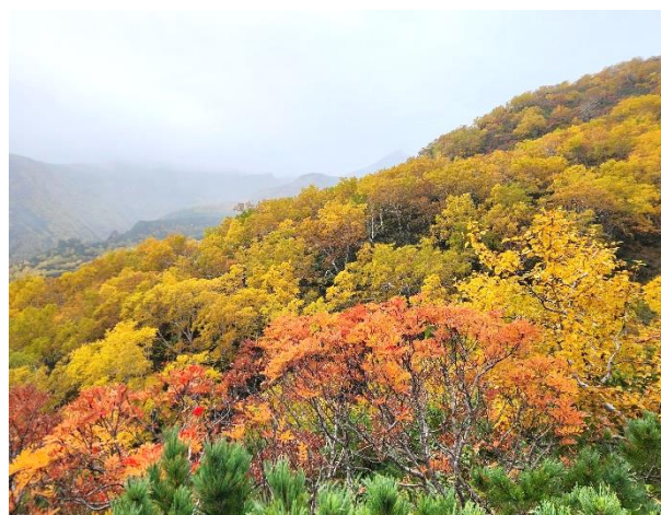
③あまりょうの滝周辺(七合目散策路展望台より)

①9/26 現在、黒岳の紅葉は六合目まで下りてきており、リフト乗車中もきれいに色づいた紅葉・黄葉を楽しむことができます。リフト下は赤く色づいたチングルマの草紅葉が見事です。②黒岳七合目登山口周辺も紅葉の見頃を迎えています。リフトを下りて左に進むと七合目にある散策路『黒岳カムイの森のみち』入口があります。③七合目の散策路終点にある展望台から見えるあまりょうの滝周辺の紅葉も見頃を迎えています。