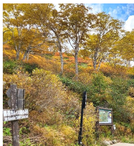
②黒岳七合目登山口周辺