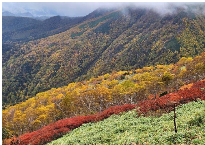
④黒岳八合目登山道からの眺望

※黒岳では9/20夜に初雪が降りました。日中は暖かくても、朝晩は冷えます。防寒装備をお忘れなく。