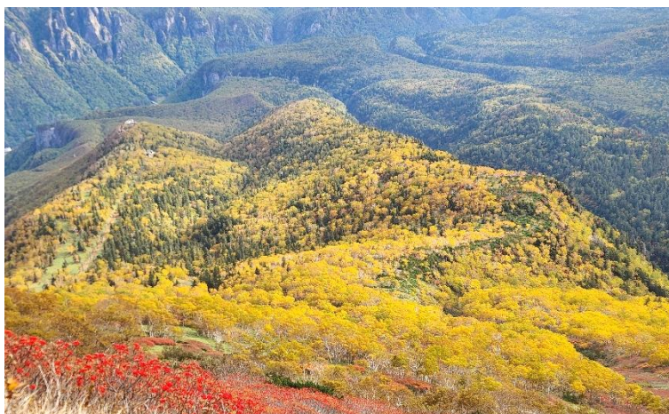
⑤黒岳山頂下からの眺望

④⑤八合目から山頂部までは褐葉、落葉しているものばかりで紅葉は終わってしまっていますが、ウラジロナナカマドの赤い実が残っており、彩りを添えてくれています。八合目から山頂下までの登山道からの眺望は、七合目周辺や赤石川下流部、銀河・流星の滝上流部の黄葉を一望することができ、見応え十分です。※黒岳石室の営業は9/30 宿泊までです。石室の隣にあるバイオトイレも10/1に閉めるそうです。ご注意ください。