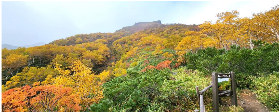
【七合目にある散策路『黒岳カムイの森のみち』展望台から望む黒岳北東斜面】