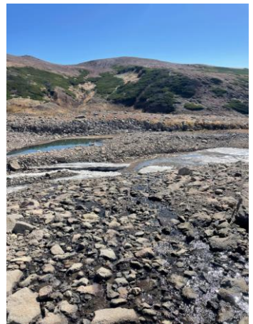
⑧板垣新道底部の残雪