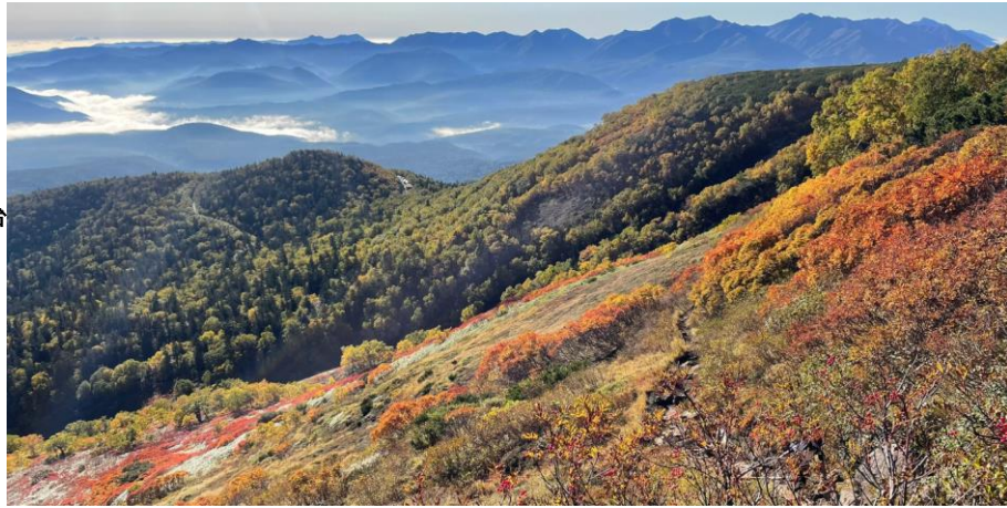
第一花園から銀泉台方面俯瞰