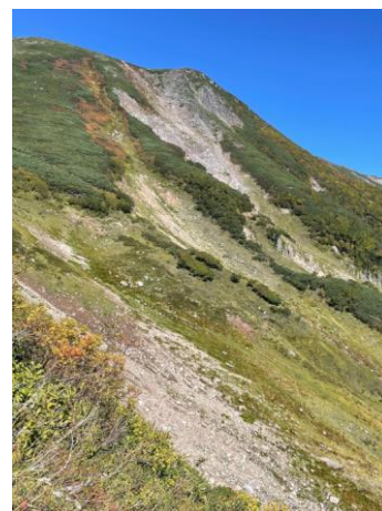
④エイコの沢ガレ場