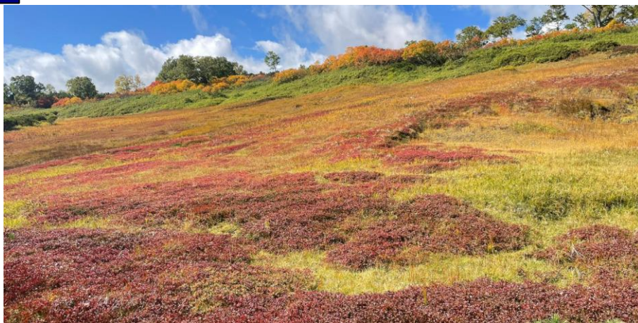
第二花畑の紅葉(スカイライン付近がウラジロナナカマド、手前がチングルマ)