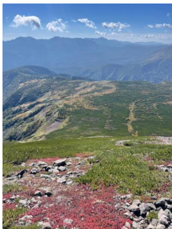
⑥岩塊斜面上部から花畑俯瞰