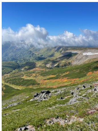
⑤岩塊斜面上部から南沢俯瞰