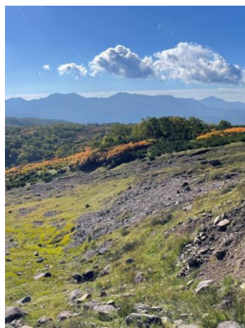
③シバ山尾根上部と東大雪