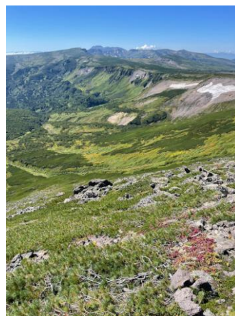
④南沢から高根ヶ原方面