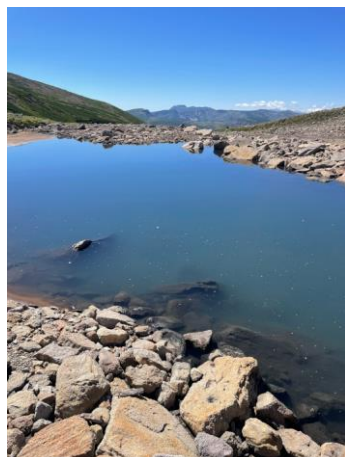
⑦板垣新道底部の水たまり