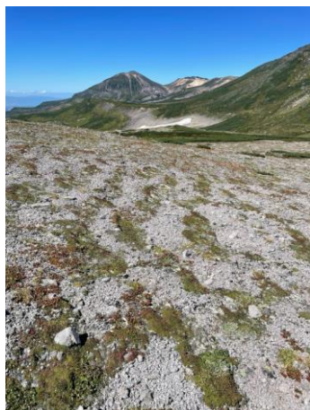
⑤山頂から旭岳方面