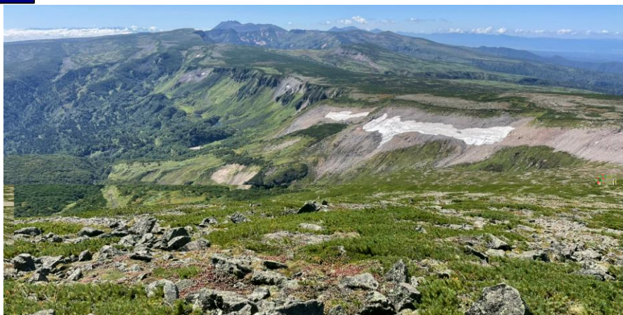
山頂から高根ヶ原方面