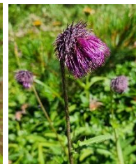
エゾノミヤマアザミ