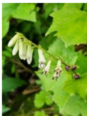
コモチミコウモリ