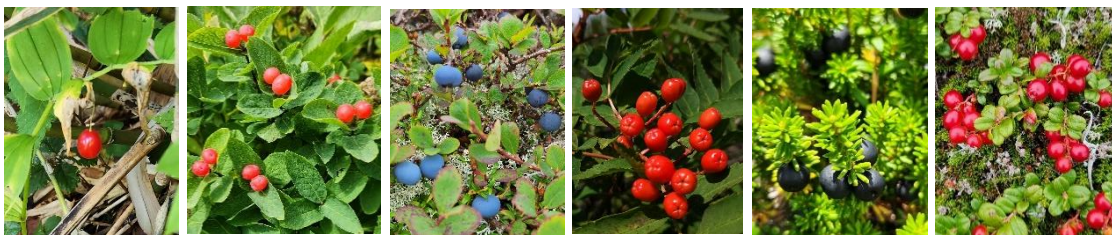
ヒメタケシマランの実 チシマヒョウタンボクの実 ヒメクロマメノキの実 ウラジロナナカマドの実 ガンゴウランの実 コケモモの実