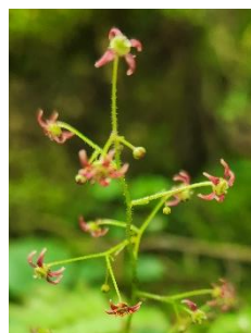
エゾクロクモソウ