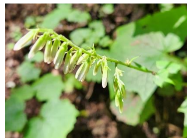
コモチミミコウモリ