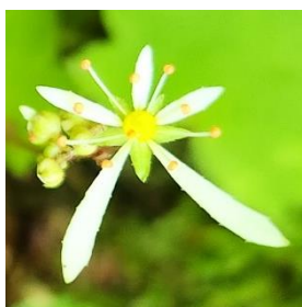
ダイヤモンドソウ