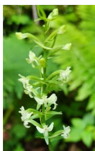
オオヤマサギソウ