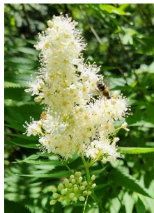
ホザキナナカマド