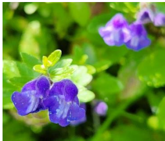
ナミキソウ(東屋の下で群生)