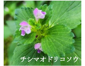
チシマオドリコソウ