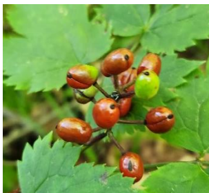
アカミノルイヨウショウマ