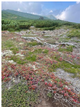
⑤コマクサ平より黒岳遠望