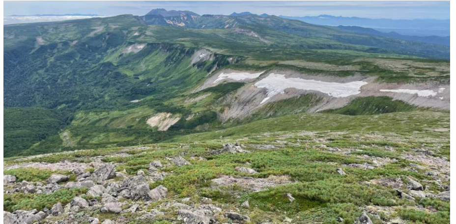
山頂から高根ヶ原方面