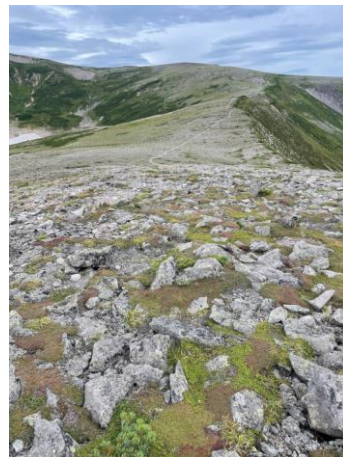
⑦山頂から小泉平方面