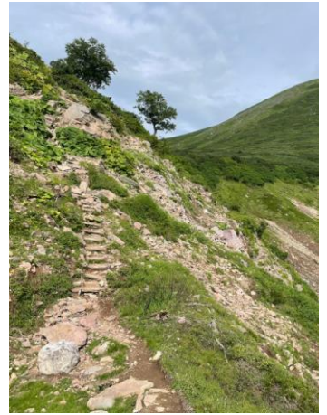
④エイコの沢ガレ場