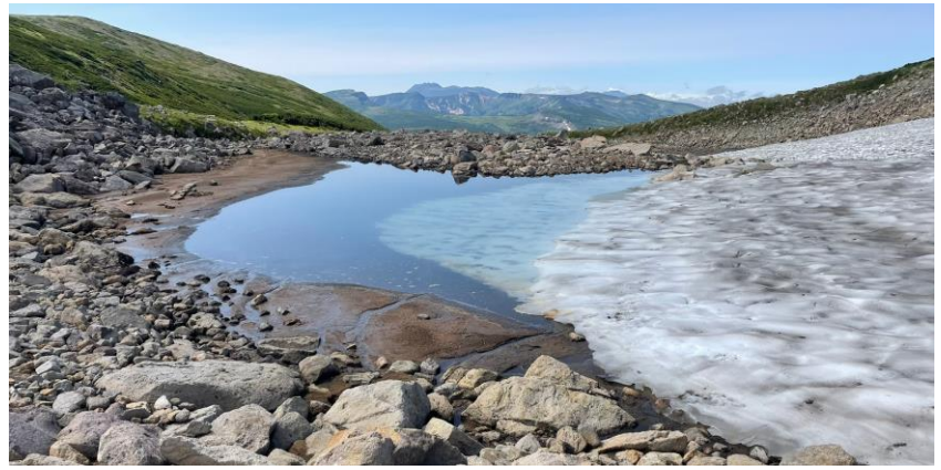
板垣新道に出現した融雪水たまり