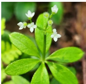
オククルマムグラ