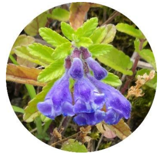
奥の道路脇の斜面にナミキソウが群生し始めています。