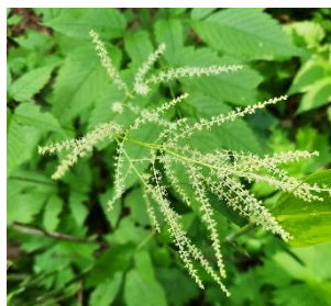
ヤマブキショウマ