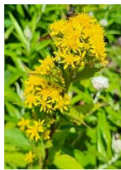
ミヤマアキノキリンソウ