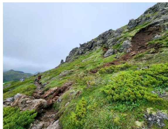
⑦北海岳近くのクジャク岩付近

⑤赤石川付近ではバイケイソウの群生が見事です。⑥7/23夜から7/24にかけての大雨の後でしたが、この日(7/25)の赤石川の水量は石室側でいつもより多めだったものの、蛇筥は露出しており、北海岳側の方の石もしっかり水面から出ている状態であったため、渡渉には支障ありませんでした。⑦大雨の影響のため、北海岳から北海沢方面へ下ったところ(北海岳から500mほどの地点)にあるクジャク岩付近で崩落がありました。25日現在、大きな石が登山道を塞いでいます。何とか登山道を通ることはできる状態ですが、通過予定の方はお気をつけ下さい。(※可能であればコース変更をおすすめします。)