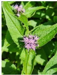
ナガバキタアザミ