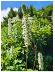
タカネウウチソウ