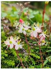
チシマツガザクラ

【開花状況】【七合目～九合目】チシマアザミ・チシマノキンバイソウ・ハクサンチドリ・モミジカラマツ・トカチフウロ・エゾヒメクワガタ・オオカサモチ・ダイセツトリカブト・エゾウサギギク・マルバシモツケ・ハクサンボウフウ・ヤマブキシヨウマ・オニシモツケ始・ミヤマアキノキリンソウ始・ナガバキタアザミ始・ウメバチソウ始・ヤマハハコ始・コモチミミコウモリ始・ハクセンナズナ始・イワギキョウ始・ウラジロタデ始・リンネソウ始など【山頂～ポン黒】メアカンキンバイ・コマクサ・イワブクロ・エゾツツジ・エゾイワツメクサ・チシマキンレイカ・ゴゼンタチバナ・イワギキョウ・チシマツガザクラ・ウスユキトウヒレン始・サマニヨモギ始など【石室周辺】エゾノツガザクラ・コエゾツガザクラ・エゾコザクラ・ヨツバシオガマ・ミヤマリンドウ・チングルマ・ミヤマアキノキリンソウ始など【雲ノ平】イワブクロ・バイケイソウ・チシマツガザクラ・コマクサ・ミヤマリンドウ・ヨツバシオガマ・シラネニンジンなど【赤石川方面】エゾコザクラ・バイケイソウ・ミヤマリンドウなど