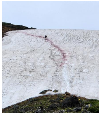
⑥北鎮岳分岐下遠景