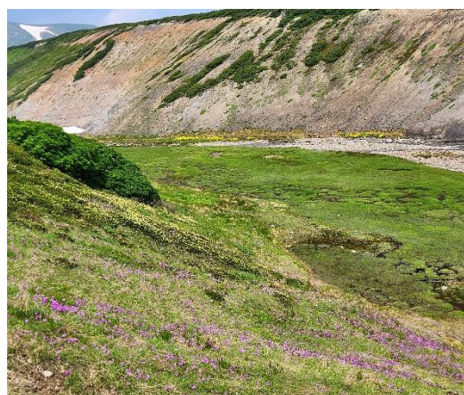
⑥赤石川周辺(美ヶ原)