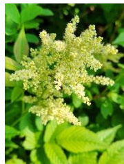
ヤマブキシヨウマ