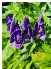
ダイセツトリカブト