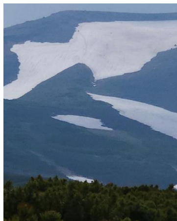
②北嶺岳分岐下遠景