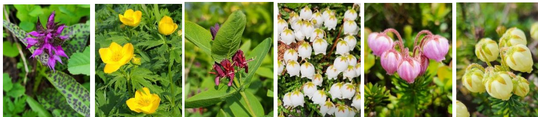
ウズラバハクサンチドリ チシマキンバイソウ チシマヒヨウタンボク イワヒゲ コエゾツガザクラ アオノツガザクラ

【開花状況】【七合目～九合目】ウコンウツギ・ミヤマキンボウゲ・ハクサンチドリ・ウズラバハクサンチドリ・カラマツソウ・ジンヨウキスミレ・キバナノコマノツメ・エゾノハクサンイチゲ・ミヤマクロユリ・チシマノキンバイソウ・トカチフウロ・ウラジロナナカマド・チシマヒヨウタンボク始など【山頂～ポン黒】メアカンキンバイ・イワヒゲ・コマクサ・イワウメ・エゾノツガザクラ・エゾタカネスミレ・ホソバイワベンケイ・ヒメイソツツジ始など【石室～雲ノ平】キバナシャクナゲ・チングルマ・エゾノツガザクラ・コエゾツガザクラ・ミヤマキンバイ・エゾコザクラ・ウラジロナナカマド始・ヨツバシオガマ始など【赤石川方面】エゾコザクラ・キバナシャクナゲ・ミネズオウ始・ミヤマキンバイ・ウラジロナナカマド始・エゾノツガザクラ・コエゾツガザクラなど