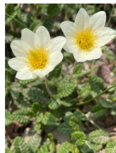
チョウノスケソウ