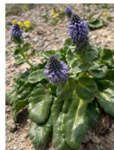
ホソバウルップソウ