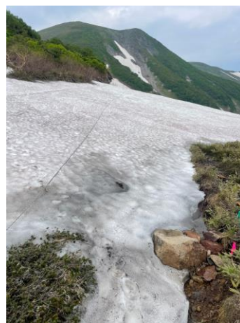
④エイコの沢ガレ場手前