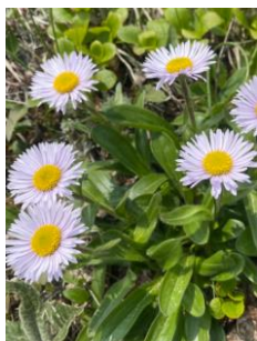
ミヤマアズマギク