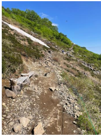
②第一花園看板付近