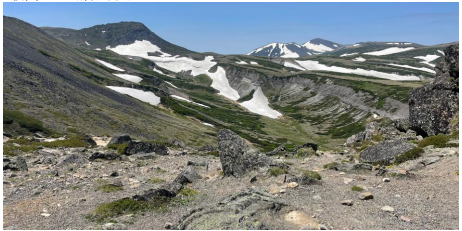
赤岳山頂から白雲岳(左)と旭岳(右)