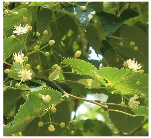
入り口看板近くにあるシナノキの花