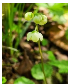
コバノイチャクソウ