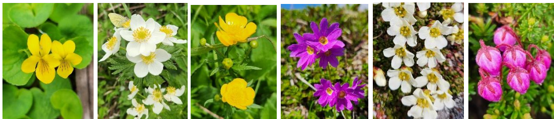
キバナノコマノツメ エゾノハクサンイチゲ ミヤマキンポウゲ エゾコザクラ イワウメ エゾノツガザクラ

【開花状況】【九合目】エゾノイワハタザオ・ショウジョウバカマ・ジンヨウキスミレ・キバナノコマノツメ・ミヤマキンポウゲ・エゾノハクサンイチゲ・エゾイチゲ 【山頂～雲ノ平】メアカンキンバイ・ミネズオウ・イワウメ・コメバツガザクラ・ミヤマキンバイ・エゾコザクラ・キバナシヤクナゲ・エゾノツガザクラ・エゾノタカネヤナギ・ミヤマハンノキ・コマクサ始・エゾタカネスミレ始など【北海沢】ジムカデ・キバナシヤクナゲ・エゾコザクラなど