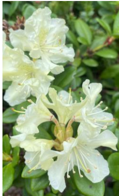
キバナシャクナゲ