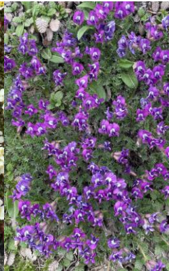
エゾオヤマノエンドウ