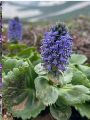
ホソバウルップソウ