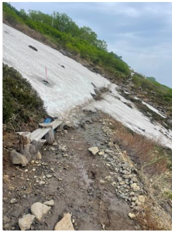
②第一花園看板付近