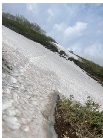
②第一花園看板付近