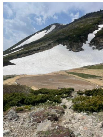
⑧白雲小屋テント場