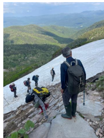
④エイコの沢ガレ場

第一花畑ではすでに木道が露出している①。第一と第二のあいだの回廊部もほとんど雪はない②。第二花畑はここ数日以内に木道が露出しそう③。エイコの沢ガレ場には残雪と岩場のあいだにシュルンドができており、谷側を回り込むようにルートが設定されている④。