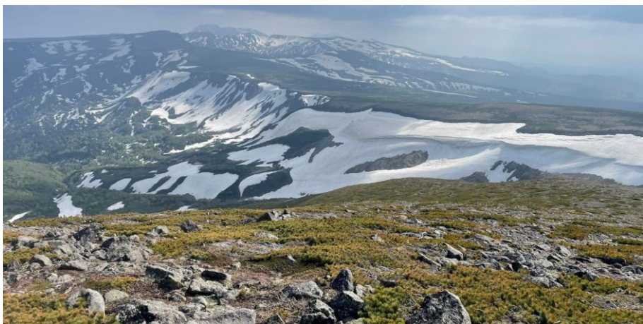
松浦岳(緑岳)山頂より高根が原方面