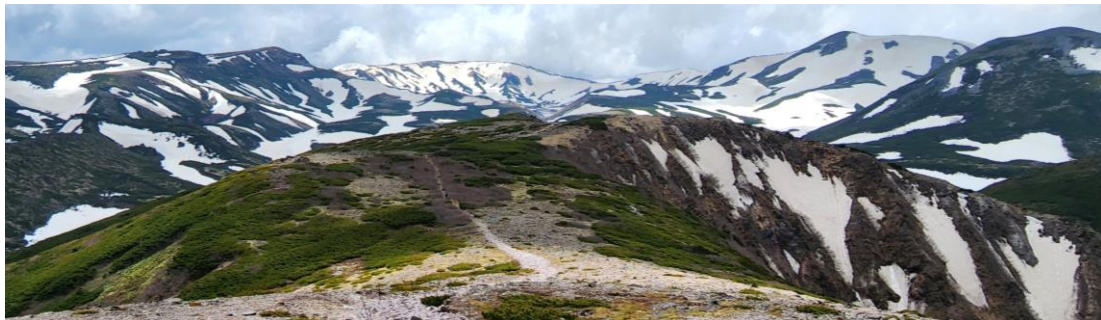
黒岳山頂からの眺望