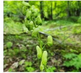
エゾノレイジンソウ