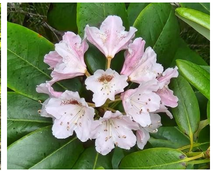
九十九橋付近のハクサンシャクナゲ 6/6