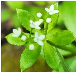
オククルマムグラ