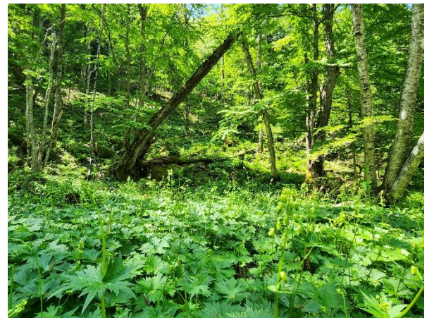
エゾノレイジンソウの群生が広がるクマゲラ広場