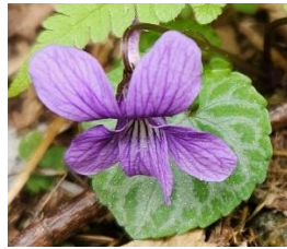
フイリミヤマスマレ