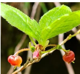
コヨウラクツツジ