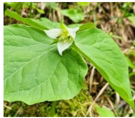
ミヤマエンレイソウ