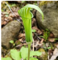
コウライテンナンショウ