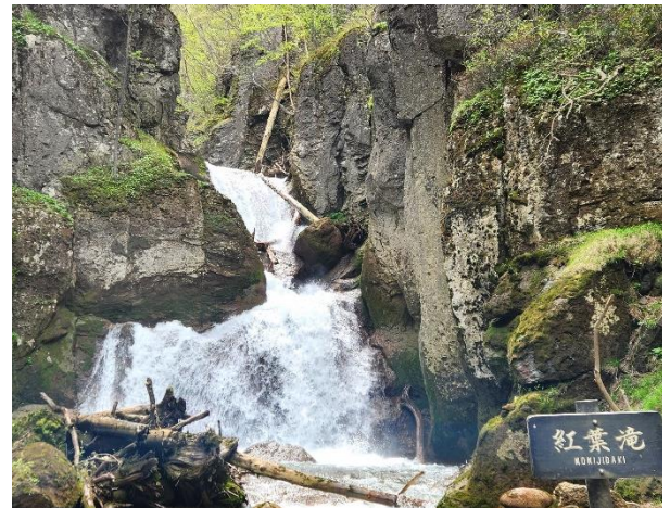
紅葉滝：雪解けで水量が多く豪快です