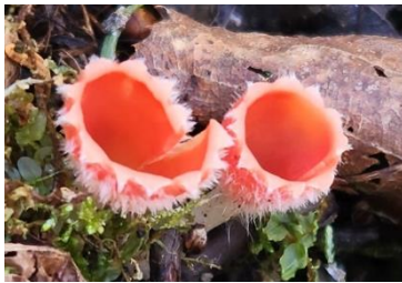
シロキツネノサカズキモドキ

散策路上の雪は消失しましたが、奥に進むと道幅が狭かったり、木の根が出ていたりします。足元に気をつけて散策を楽しんでください。