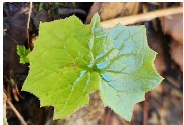
コモチミミコウモリの若葉