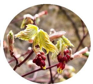
ハウチワカエデの蕾

散策路上の雪は消失しましたが、奥に進むと道幅が狭かったり、木の根が出ていたりします。足元に気をつけて散策を楽しんでください。