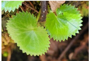
エゾクロクモソウの若葉