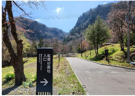
入口看板付近の様子

ようやく層雲峡にも桜前線が到達！紅葉谷のエゾヤマザクラもぼつぼつ咲き始めました。入口周辺ではイタヤカエデの黄色い花がきれいです。散策路から見える柱状節理には色鮮やかに咲くエゾムラサキツツジが見られます。散策路上ではヒメイチゲやエゾムラサキツツジが咲いています。エンレイソウももうすぐ咲きそうです。 ※尚、落石や倒木、ヒグマなどには十分ご注意ください。