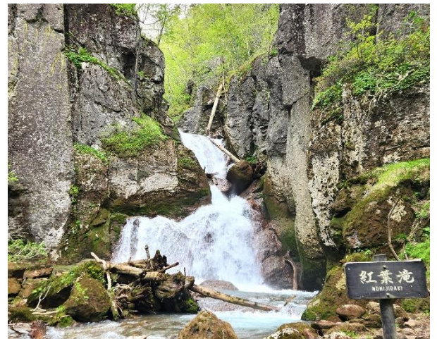
紅葉滝：滝の周りの新緑やコケも美しいです。