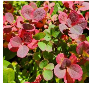
ヒメクロマメノキ