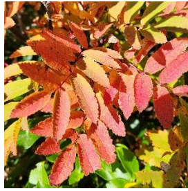
ウラジロナナカマド