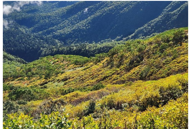
③黒岳九合目周辺マネキ岩下部沢筋

①②③黒岳の登山道沿いではすでに枯れているものも目立ってきましたが、マネキ岩下部の沢筋では下の方で薄い赤や橙色に色づいてきていました。全体的にはまだ緑葉のものも多いため、今後の色づきに期待したいところです。(予報では20日まで暖かい日が続き、その後、気温が下がるようです。21日以降の冷え込みに期待大!です。)