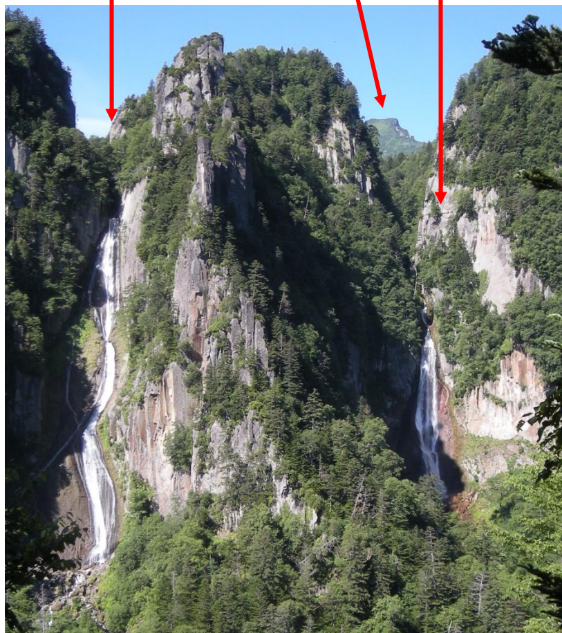
⑤：双瀑台からの壮大な眺め