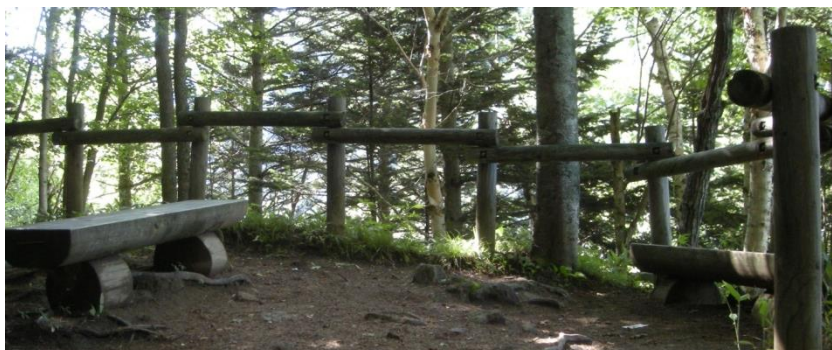
④：③から約5分で双瀑台に到着です。狭い場所になりますので、十分注意してください。