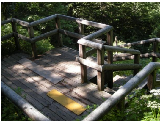
②：約10分で第一展望台 下の写真はその眺め