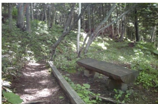
③：②から約10分でベンチがあります