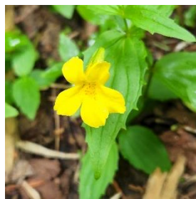
オオバミズホオズキ