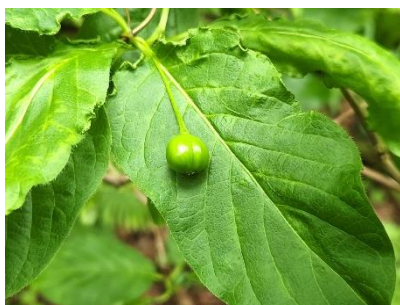
エゾヒョウタンボク