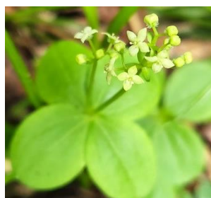
エゾノヨツバムグラ