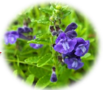
奥の道路脇の斜面にナミキソウが群生しています。