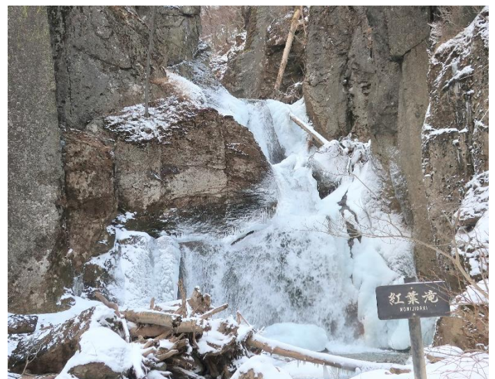
周りが凍り始めている紅葉滝。しぶき氷も見られました。