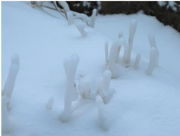
まるでニョロニョロのような飛沫着氷。(紅葉滝付近)