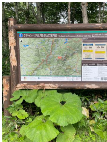
①クチャンベツ登山口

下部樹林帯：コバノイチヤクソウ オガラバナ種子 沼ノ原湿原：シラネニンジン・ハクサンボウフウ↓ タチギボウシ・ エゾオヤマノリンドウ・ウメバチソウ↑