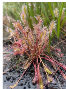
ナガバノモウセンゴケ