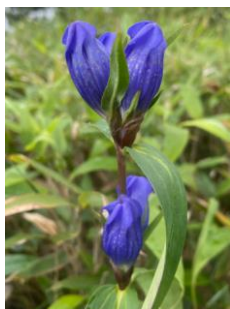
エゾオヤマノリンドウ