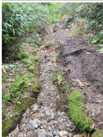
⑤侵食の酷い登山道

木道が出てくるとすぐに、沼ノ原分岐となり、池塘や湿原にはタチギボウシやシラネニンジンなどが咲いている⑦。分岐から20分ほどで大沼に到着する⑧。