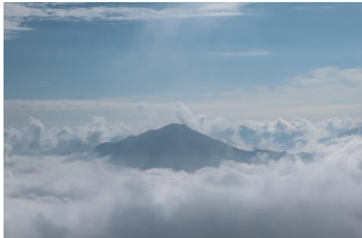
①黒岳北東斜面から見た雲海と屏風岳

【開花情報】【九合目～山頂】ダイセツトリカブト・ハイオトギリ・ミヤマアキノキリンソウ・チシマアザミ・ナガバキ タアザミ・ウメバチソウ・エゾニュウ・タカネトウウチソウ○ ヤマハハコ・オオカサモチ・ヤマブキシヨウマ↑・オ ニシモツケ・エゾノレイジンソウ・コモチミミコウモリ↑ チシマノキンバイソウ・トカチフワロ・マルバシモツケ・エ ズウサギギク・ハクサンボウフウ・エゾヒメクワガタ↓ ミヤマホツツジ・ミヤマアカバナ始【山頂～石室】・メアカン キンバイ・エゾイワツメクサ・イワブクロ・エゾコザクラ・イワギキョウ・ヨツバシオガマ・ミヤマリンドウ・ハクサ ンボウフウ○ ヒメイワタデ↑ コマクサ・チングルマ・エゾノツガザクラ・ゴゼンタチバナ↓ サマニヨモギ始