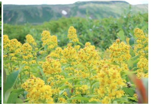
③お鉢平展望台周辺

ロープウェイ乗車中は、濃霧で辺りは真っ白だったのですが、ロープウェイ黒岳駅に近付いたとたん、霧が晴れて青空に！そして、七合目のロッジに着く頃には、眼下に見事な雲海が広がっていました。雲海の上にそびえ立つ屏風岳は神々しかったです①。黒岳の登山道では、夏の花もそろそろ終わりを迎えつつあります。斜面を彩っていたチシマノキンバイソウは、まだ咲いていますが数はぐっと減り、代わりにダイセツトリカブトやミヤマアキノキリンソウ、アザミ類などの秋の花が目立っています。黒岳山頂下の斜面ではチシマアザミとオニシモツケが群落を形成していました。その足下ではハイオトギリが咲き誇っており、鮮やかな黄色が眩しかったです②。お鉢平展望台周辺では、ミヤマアキノキリンソウが小群落を形成していました。今が最盛期です③。