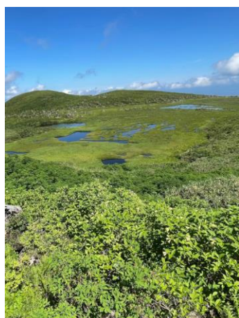
⑤四ノ沼展望地より