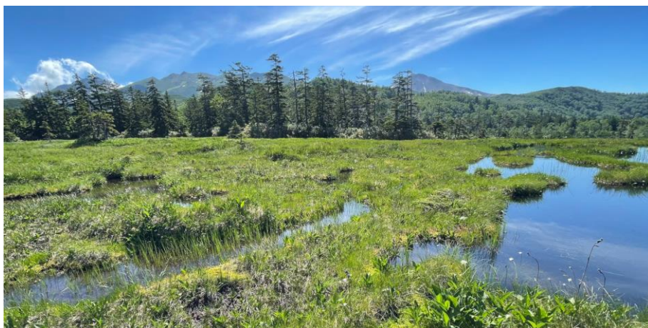
三ノ沼付近から大雪山の眺望