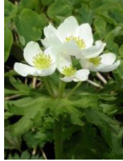
エゾノハクサンイチゲ