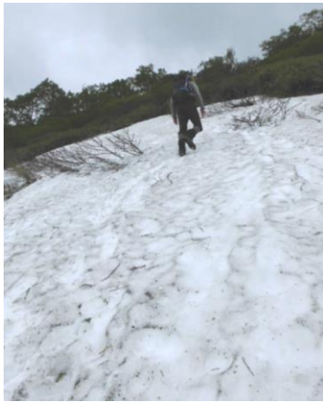
①黒岳七合目～八合目中間

【開花状況】【九合目】エゾイワハタザオ・ミヤマキンポウゲ・エゾノハクサンイチゲ↑ 【九合目上】キバナノコマノツメ○ エゾイワハタザオ・ショウジョウバカマ↓ ミヤマキンポウゲ始 【山頂下】ミヤマキンポウゲ・エゾノハクサンイチゲ・キバナノコマノツメ↑ エゾイワハタザオ↓ ハクサンチドリ始 【ボン黒岳】コメバツガザクラ○ミヤマキンバイ・メアカンキンバイ・キバナシャクナゲ・ミネズオウ・イワウメ↑ エゾノツガザクラ始