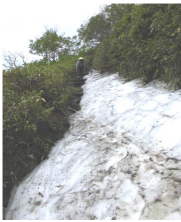
②黒岳八合目標柱下