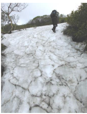
③黒岳八合目標柱上