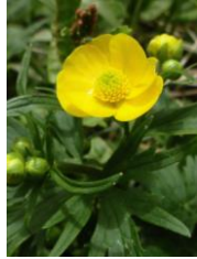
ミヤマキンポウゲ