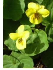
キバナノコマノツメ