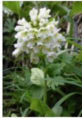
エゾイワハタザオ