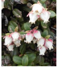
コメバツガザクラ

【開花状況】【九合目】エゾイワハタザオ・ミヤマキンポウゲ・エゾノハクサンイチゲ↑ 【九合目上】キバナノコマノツメ○ エゾイワハタザオ・ショウジョウバカマ↓ ミヤマキンポウゲ始 【山頂下】ミヤマキンポウゲ・エゾノハクサンイチゲ・キバナノコマノツメ↑ エゾイワハタザオ↓ ハクサンチドリ始 【ボン黒岳】コメバツガザクラ○ミヤマキンバイ・メアカンキンバイ・キバナシャクナゲ・ミネズオウ・イワウメ↑ エゾノツガザクラ始