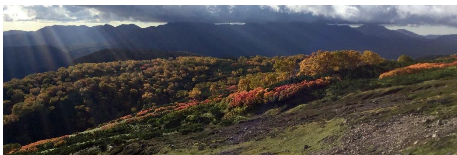
黄葉のシバ山尾根と石狩岳の稜線(後方)