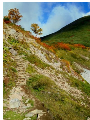
⑧エイコの沢ガレ場