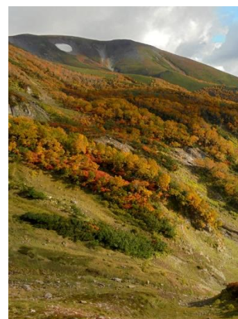
⑦エイコの沢から小泉岳方面