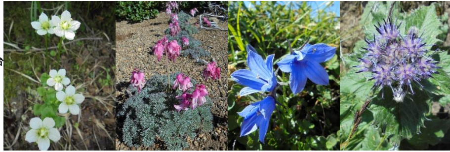
ウスユキトウヒレン