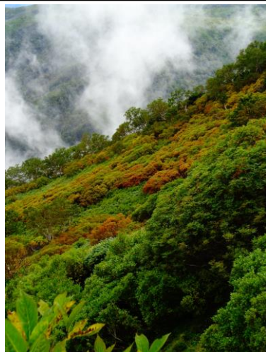
②黒岳九合目周辺まねき岩下部