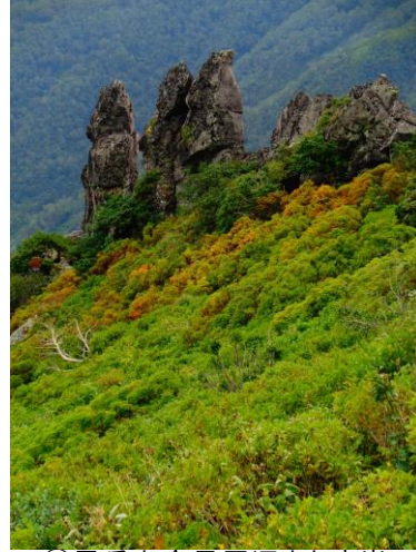
②黒岳九合目周辺まねき岩