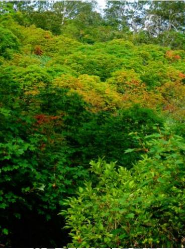
①黒岳七・八合目周辺