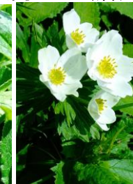
エゾノハクサンイチゲ