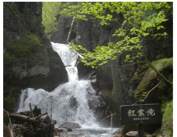
紅葉滝: 雪解けで水量が多く豪快です