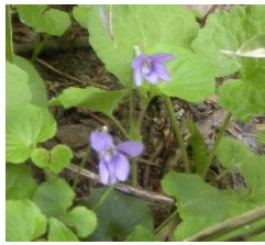
オオタチツボスマレ