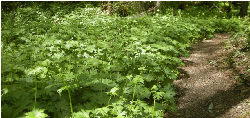
クマゲラ広場のエゾレイジンソウがもうすぐ満開になります