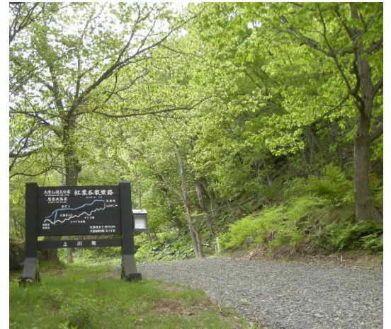
入り口看板付近の様子