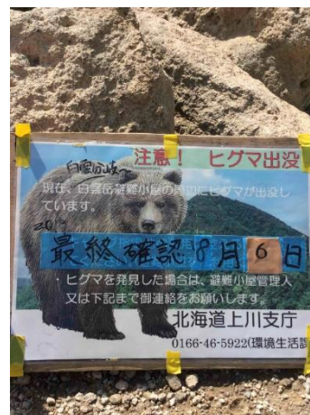
⑧ 白雲小屋テント場