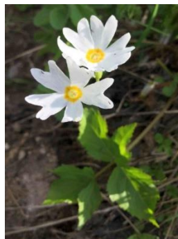
エゾコザクラ白花