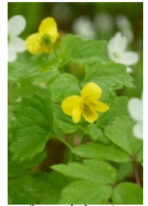
ジンヨウキスミレ

【コマクサ平】コマクサ、ミヤマキンバイ、メアカンキンバイ、イワウメ、エゾイソツツジ、ジンヨウキスミレ、ヒメクロマメノキ、チシマキンレイカ、