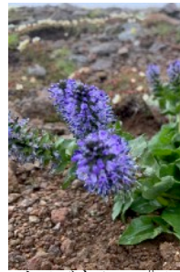
ホソバウルップソウ