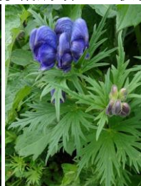
ダイセツトリカブト