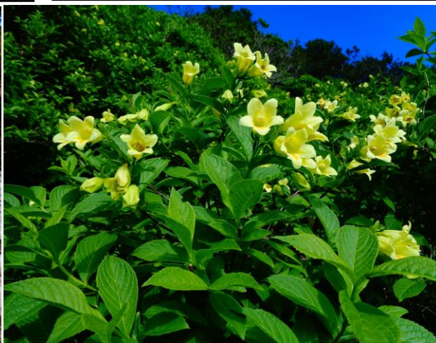
②黒岳八～九合目周辺