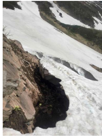
③アイコの沢ガレ場