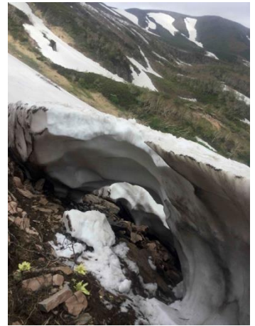
④アイコの沢ガレ場

下部樹林帯は登山道の半分ほどが雪に覆われている①。第一花畑からアイコの沢ガレ場までは全面雪で、マーカーはほとんどなく、ルートファインディング技術が必要②。