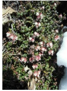
コメバツガザクラ