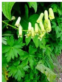
エゾノレイジンソウ