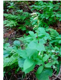
コモチミミコウモリ