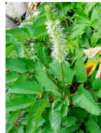
タカネトウチソウ