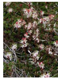
チシマツガザクラ

【開花】【八～頂】ウコンウツギ・ヤマハハコ・ミヤマキンポウゲ・チシマノキンバイソウ・ナガバキタアザミ・ハクサンチドリ・カラマツソウ・トカチフウロ・ハクサンボウフウ・タカネトウウチソウ・ハイオトギリ・ハクセンナズナ・ウメバチソウ・エゾヒメクワガタ・チシマヒョウタンボク・タカネスイバ・マルバシモツケ【頂～石室】エゾイワツメクサ・タカネオミナエシ・ヨツバシオガマ・チシマツガザクラ・イワギキョウ・イワブクロ・メアカンキンバイ・ミヤマキンバイ・キバナシヤクナゲ・エゾツツジ・ヒメイソツツジ・エゾツガザクラ・コマクサ・エゾコザクラ・チングルマ・ヒメイワタデ・ミヤマリンドウ・アオツガ等