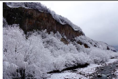
11/4 峡谷に見事な樹氷が現れました