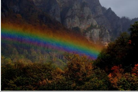
9/30 峡谷上に実に濃い虹が現れました