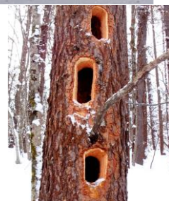
1/21 巨大な氷柱群が出来ていました～大函 1/24 飛び立ち損ねて雪山にすぼり～アトリ 2/22 大きな採餌木～クマゲラ