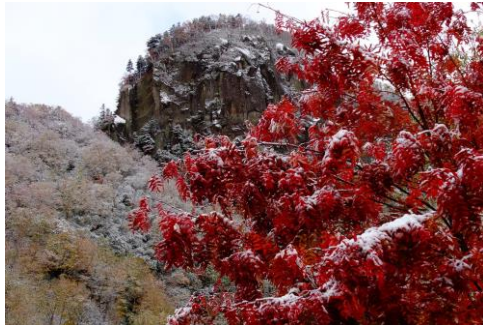
10/4 峡谷上に雪が被りました