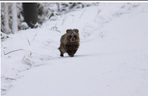
11/16 犬かと思いました～エゾタヌキ