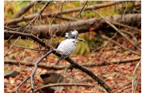
10/17 久しぶりにヤマセミに出会いました