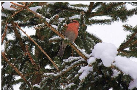
12/3 下界に降りてきました～ギンザンマシコ