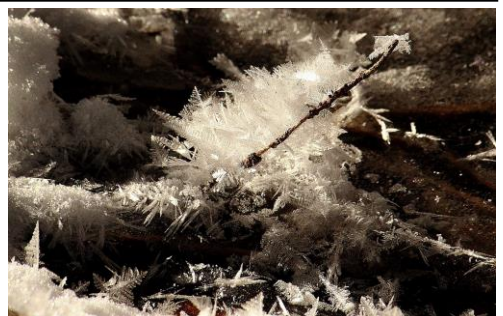
12/9 高さのあるフロストフラワー（氷の華）