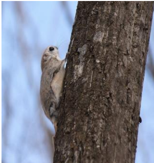
10/21 エゾモンガ・樹洞から出ていました