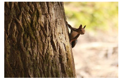
10/28 樹木からいきなり顔を出しました