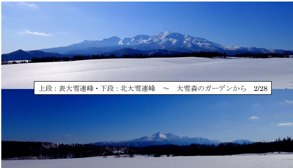
上段：表大雪連峰・下段：北大雪連峰 ～ 大雪森のガーデンから 2/28

☆チピターニュース/山の実2018年1月25日(木)第83号☆2017年を振り返って～山・山麓での出来事 ほんの一部をご紹介します