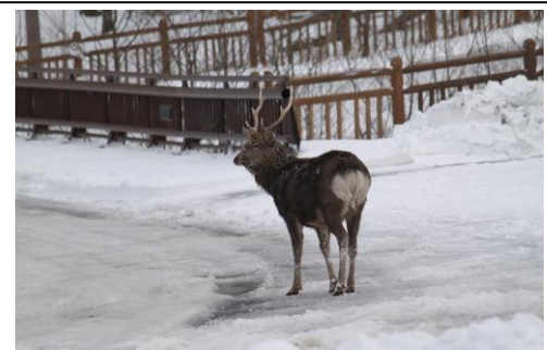
11/12 道路なんですけど・・・雄鹿