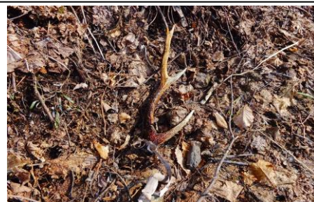
4/5 オジロワシ幼鳥～越冬しました 4/6 外来種ミンク～既に3例目の目撃です 4/6 エゾシカ落角～毎年春先に落ちます