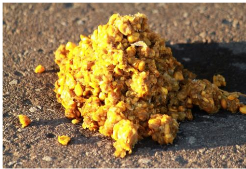
10/28 デントコーンのみの熊フン