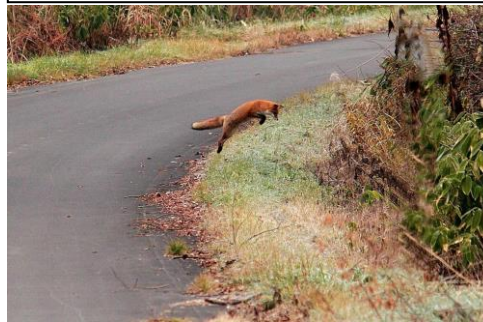
11/3 キタキツネ ネズミの狩り中