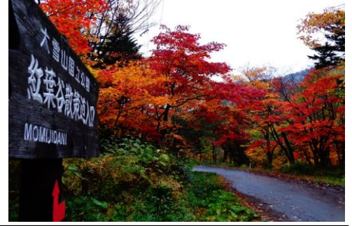
10/4 層雲峡散策名所：紅葉谷