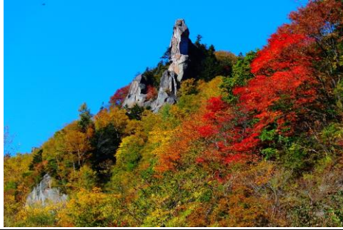
10/1 層雲峡峡谷の紅葉も見事です