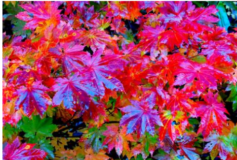
10/14 雨に濡れ光り輝くハウチワカエデ